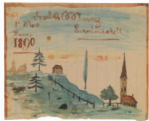
Paul Klee, Zomerlandschap, 1890, Zentrum Paul Klee, Bern, particuliere collectie