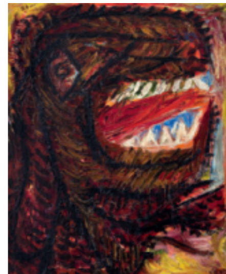
Asger Jorn, Falbo II, 1951, Canica Kunstsamling, Oslo

De relatie tussen Klee en Cobra vormt het hart van de tentoonstelling. Daaromheen ontvouwt zich een ontdekkingsreis door het hele oeuvre van zowel Klee als Cobra aan de hand van vijf thema's. Hierin worden verwantschappen, maar ook verschillen duidelijk. Dit levert verrassende confrontaties op. De veelzijdigheid van zowel Klee als Cobra komt tot uiting door het gebruik van verschillende media: olieverfschilderijen, werken op papier, gemengde technieken en sculpturen.