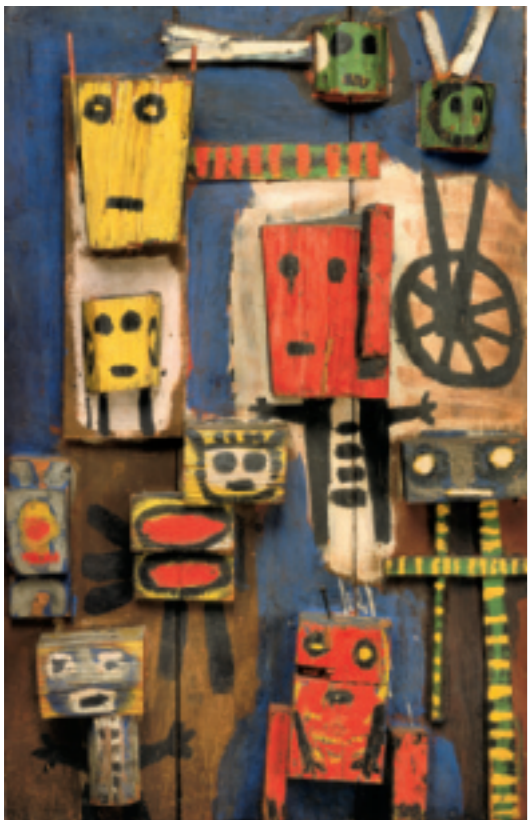
Karel Appel, Vragende kinderen, 1949, Stedelijk Museum, Amsterdam