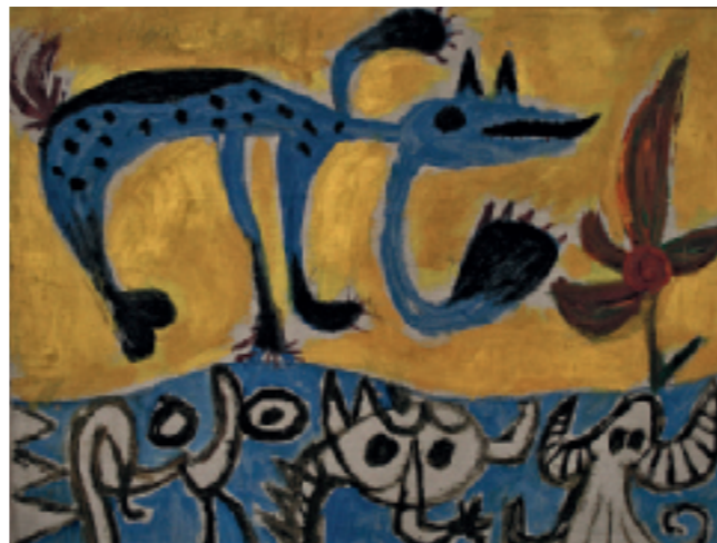
Constant, Fantasiedieren, 1949, Kunsten Museum of Modern Art Aalborg