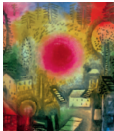
Paul Klee, Zomerlandschap, 1924, Triton Foundation