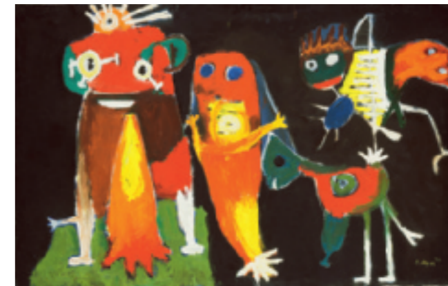
Karel Appel, Hiep, hiep, hoera!, 1949, Tate, Londen, aangekocht met steun van Evelyn, Lady Downshire's Trust Fund en Gytha Trust, 1988