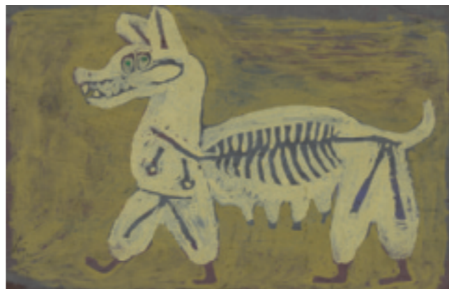
Paul Klee, Moerdier, 1937, Zentrum Paul Klee, Bern