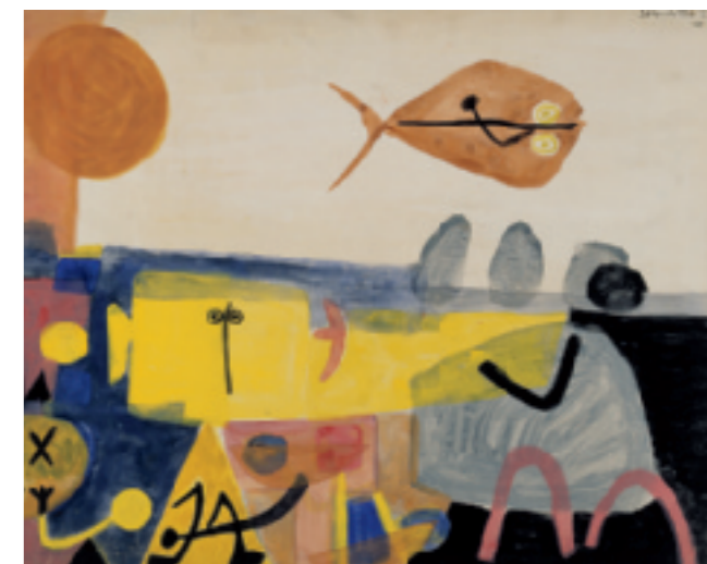
Cornelle, Vis, 1950, Stedelijk Museum Schiedam, schenking Bouw- en Aannemingsbedrijf Muys & de Winter, 1964