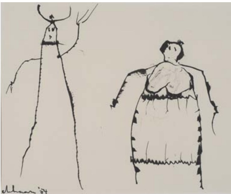
Wim de Haan, Zonder titel, o.i. inkt op papier, 1954 coll. Cobra Museum voor Moderne Kunst Amstelveen (bruikleen Stichting Wim de Haan)

Nadere reflectie op leven en werk van Wim de Haan levert eveneens een beeld op van de immens diepe poelen van ellende die hij heeft ervaren in de periode van zijn krijgsgevangenschap. Maar altijd zijn er dwarsverbindingen in deze tekeningen die erop wijzen, dat menselijk contact ook in deze momenten van totale ontluistering mogelijk bleef en van cruciale betekenis kon worden.